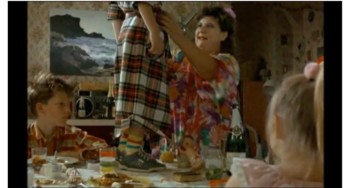
Soirée Groseille vs Le Quesnoy