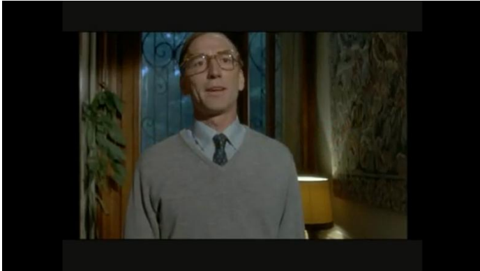
La Vie Est Un Long Fleuve Tranquille